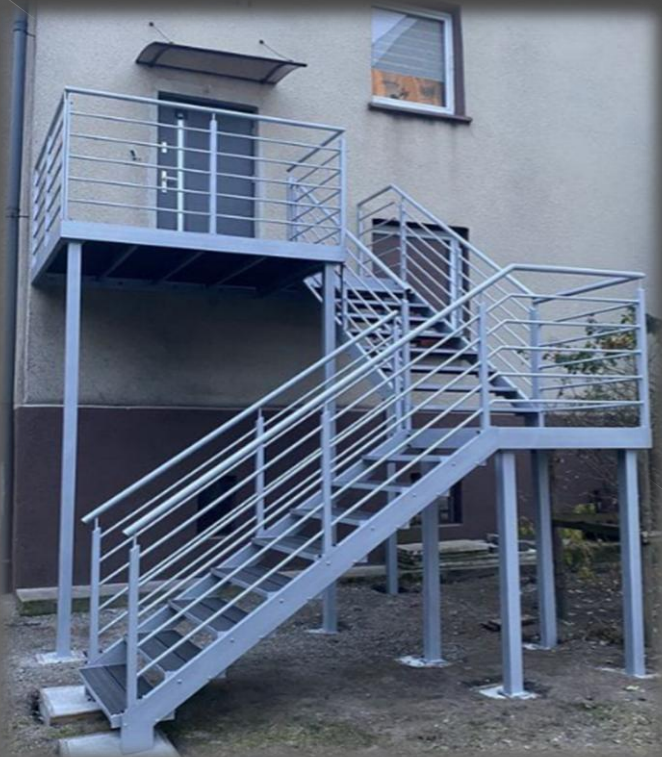
ESCADA INDUSTRIAL C/ GUARDA- CORPO